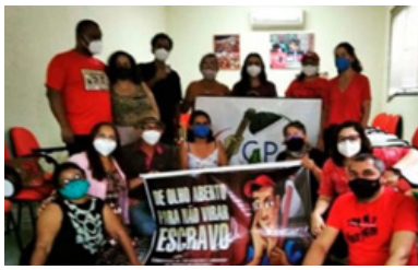
11/03/2022 - Fortaleza

No dia 11 de março de 2022 a AEFAJA participou da oficina de planejamento da Campanha de Olho Aberto para não virar Escravo, organizada pela Comissão Pastoral da Terra. Um dos objetivos da campanha é de informar a população de como podem realizar denúncias de locais que possuem condições de trabalho análogas à escravidão. Nesse ano de 2022 a campanha faz 25 anos e a AEFAJA vem se somando para contribuir com essa luta!