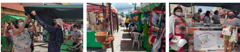
25/03/2022 - Aracati

No dia 25/03 a AEFAJA esteve presente junto com a Cooperativa Mista de Trabalho, Assessoria e Consultoria Técnico Educacional – CONTACTE na Feira Estadual Agroecológica e Solidária em Aracati. Organizada pela Cáritas junto com a Rede Bodega, esse foi o primeiro momento presencial depois que a pandemia começou, sendo um espaço importante para a agricultura camponesa e economia solidária.