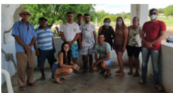
09/03/2022 - Assentamento Groenlândia Tabuleiro do Norte

Equipe Técnica do Projeto Sementes Crioulas/Tradicionais, Sustentabilidade e Agrofloresta reuniu-se, no dia 18/02, com a comunidade dos Currais, e no dia 09/03