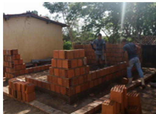
21/02/2022 – Barbatão – Palhano