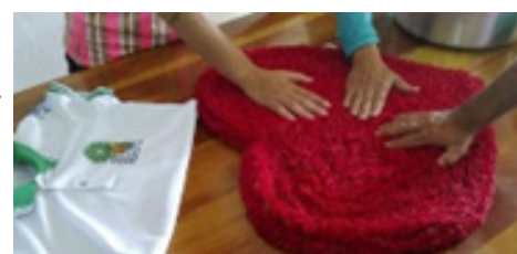
28/02/2022 - EFA Jaguaribana Tabuleiro do Norte

Em 28 de fevereiro, convocamos um encontro com o 3º ano da Escola Família Agrícola Jaguaribana Zé Maria do Tomé, nessa ocasião refletimos sobre Sociedade, Natureza e Agroecologia a partir da qualidade da nossa alimentação. O PVFC dessa turma pioneira, batizada de Turma Asa Branca, será um trabalho colaborativo e apresentará um projeto de ação com a escola e sua comunidade tendo em vista a causa maior da formação político pedagógica preconizada em seu ideário agroecológico.