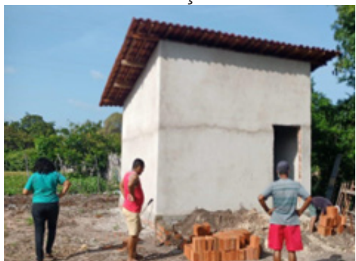
16/02/2022 – Volta Grande – Fortim

O Projeto Sementes da Vida no Vale do Jaguaribe é realizado pela AEF AJA em parceria com a COMACTE, apoiadas pela Fundação Interamericana – IAF. Ao todo serão 16 Casas de Sementes Comunitárias em 9 municípios do Vale do Jaguaribe. A seguir temos fotografias de algumas das casas em construção: