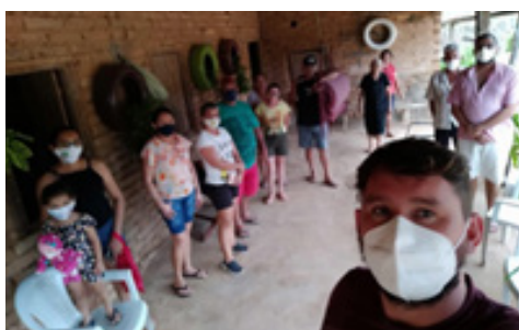
18/02/2022 - Comunidade Currais Tabuleiro do Norte