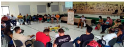
23/03/2022 - Fortaleza

A reunião ocorreu no dia 23/03, com objetivo de avaliar as ações do ano de 2021 e planejar o ano de 2022, dialogar sobre os desafios enfrentados no atual momento e discutir estratégias para a superação das dificuldades. É NO SEMIÁRIDO QUE A VIDA PULSA! É NO SEMIÁRIDO QUE O POVO RESISTE!