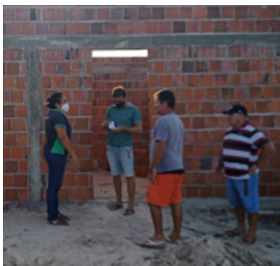
16/02/2022 – Camurim – Itaiçaba