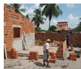
08/03/2022 Preá II - Fortim