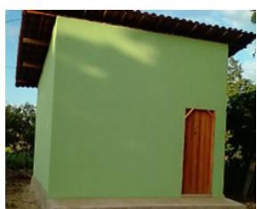
23/02/2022 Volta Grande - Fortim