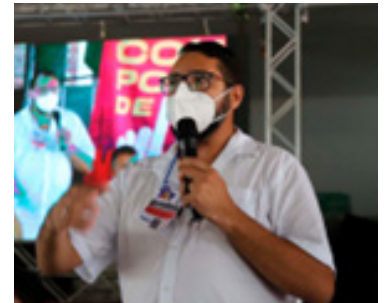
12/03/2022 - Associação Recreativa Tabuleirense (ART) Clube - Tabuleiro do Norte