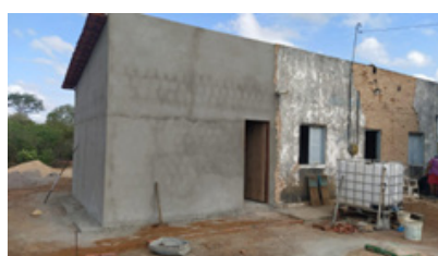
07/03/2022 Baixa do Juazeiro – Tabuleiro do Norte